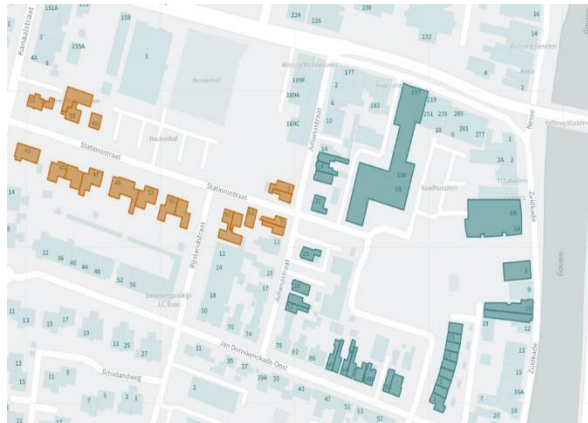
Figuur 2 Woningen die opgenomen worden

Indien er schade ontstaat aan de woning als gevolg van de bouwwerkzaamheden, kunt u een aansprakelijkheid indienen. Middels de vooropname en eindopname wordt door onafhankelijke derden bepaald of de aansprakelijkheid terecht is. De woning wordt zowel voor de start van de bouwwerkzaamheden aan de binnenzijde en buitenzijde opgenomen (vooropname). Bij het einde van de werkzaamheden wordt de binnenzijde en buitenzijde nogmaals opgenomen (eindopname).