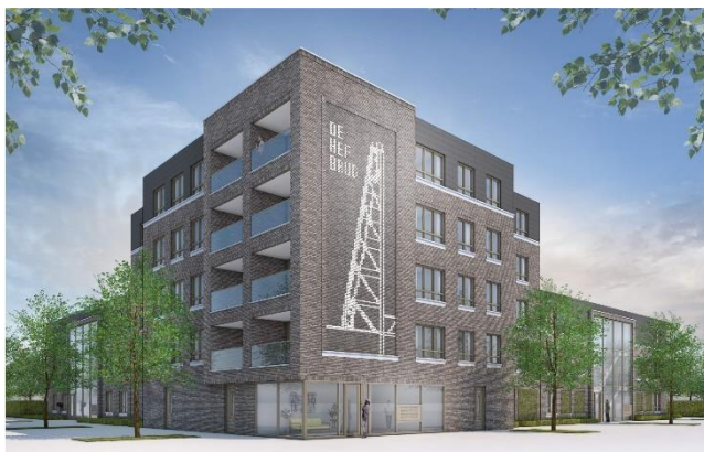
Figuur 1 Impressie van het nieuwe gebouw

Op www.sleutelkwartier.nl of www.woonpartners-mh.nl kunt u de plannen inzien.