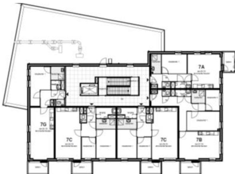
Vierde verdieping blok 7B schaal 1:200