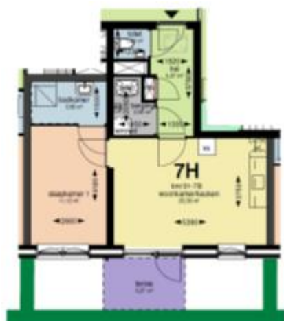
Begane grond blok 7B schaal 1:100

Woningtype 7H is 46,1 m 2 groot. U heeft keuze uit 1 appartement van dit type, begane grond. Dit appartement heeft 1 slaapkamer en een terras / tuin.