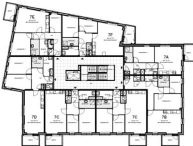
Derde verdieping blok 7B schaal 1:200