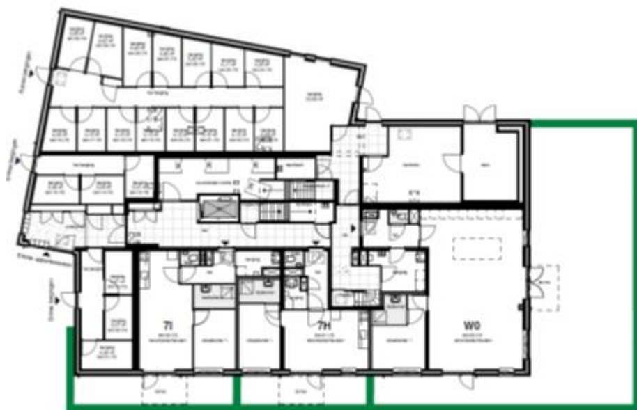
Begane grond blok 7B schaal 1:200

Deze projectdocumentatie is nauwkeurig en met zorg samengesteld aan de hand van gegevens en tekeningen. De appartementen op de 1e etage zijn voor woongroep Gouda Up.