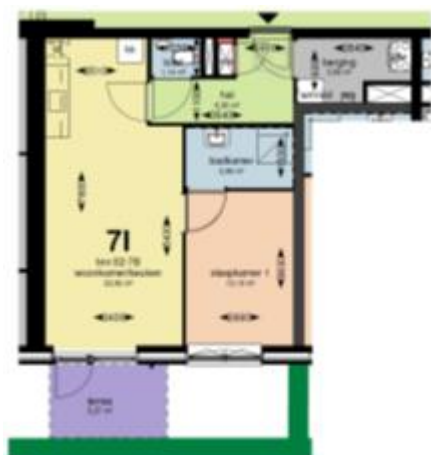
Begane grond blok 7B schaal 1:100

Woningtype 7I is 51,1 m 2 groot. U heeft keuze uit 1 appartement van dit type, begane grond. Dit appartement heeft 1 slaapkamer en een terras / tuin.